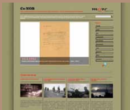
Vstopna stran portala Ce-NOB.

V MnZC smo v skladu s politiko dostopnosti oblikovali spletni portal ( http://www.ce-nob.si/ ), na katerem predstavljamo izbor našega gradiva, povezanega z drugo svetovno vojno na Celjskem: preko 600 muzejskih predmetov, dokumentov, fotografij in AV pričevanj, ki se nanašajo na eno najboljčutljivejših obdobij slovenske novejšje zgodovine. Portal, ki bo služil zlasti v izobraževalne in raziskovalne namene, sta sofinancirala Ministrstvo za