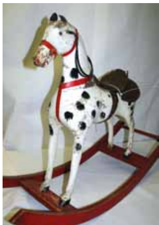
Leseni gugalni konjiček iz zbirke Otroško življenje.

Ste se v mislih vrnili v preteklost, v čas svojega otroštva, se spomnili svojih igrač, objem vaše najljubše igrače in tiho šepetanje skrivnosti v uho najljubšega medvedka, prijetnega druženja s svojimi otroškimi prijatelji? Zasedajo punčka z modrimi očmi, mehke medvedke, ploče-