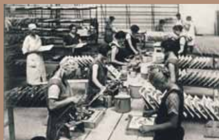
Delavke med proizvodnjo v tovarni Westen v 30. letih 20. stoletja.

Celje je bilo v 20. stoletju pomembno industrijsko središče, katerega utrip so močno zaznamovali delavci in delavska kultura. Zato bomo tej vsebini namenili poseben prostor na stalni razstavi Živeti v Celju v MnZC. V njem bo orisan razvoj delavstva v mestu, njegov delovni in bivanjski ritem ter družbena vloga. Na razstavi, ki bo odprta spomladi prihodnjega leta, želimo obiskovalce opozoriti tudi na aktualna vprašanja, kot so okoljska problematika in vloga dela ter delavstva v današnji družbi. T. K.