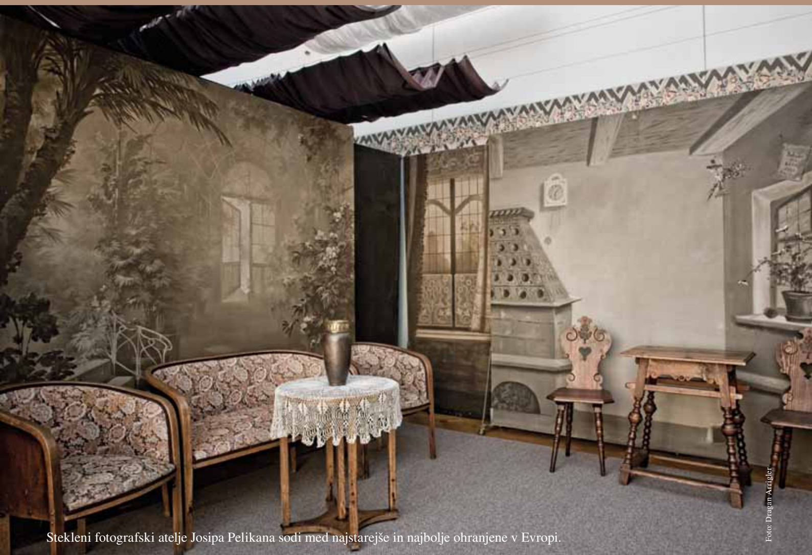
Stekleni fotografski atelje Josipa Pelikana sodi med najstarejše in najboljše ohranjene v Evropi.