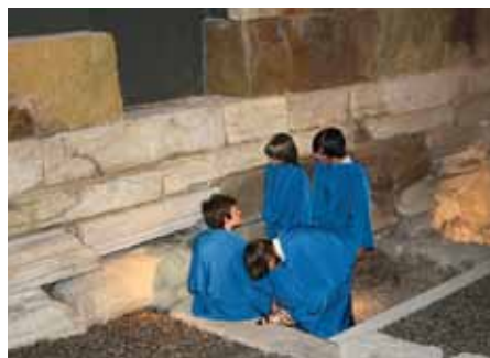
Otroci vneto raziskujejo obrambni sistem Celeie .

Delavnice na temo rimske Celeie lahko prilagodimo željam posamezne skupine. V času pozne pomladi, poletja in jeseni delavnice izvajamo v zunanjem lapidariju muzeja, kjer lahko ponudimo tudi nekaj