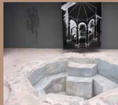
Starokrščanska krstilnica v Gubčevi ulici je bila pred kratkim ponovno obnovljena.

Antični starokrščanski kompleks je bil zgrajen konec 4. ali v začetku 5. stoletja na skrajnem vzhodnem delu mesta. Cerkev so izkopali med gradnjo Pošte, konec 19. stoletja. Dolga je bila 29 in široka 13 metrov, krasili pa so jo pisani mozaiki z donatorskimi napismi. Ti nam delno osvetljujejo družbeno okolje takratne krščanske skupnosti. Krstilnica z osmerokotnim, z marmornimi ploščami obloženim krstnim bazenom in baldahinom je bila odkrita celo stoletje kasneje in je morala pripadati drugi cerkvi. D. P.