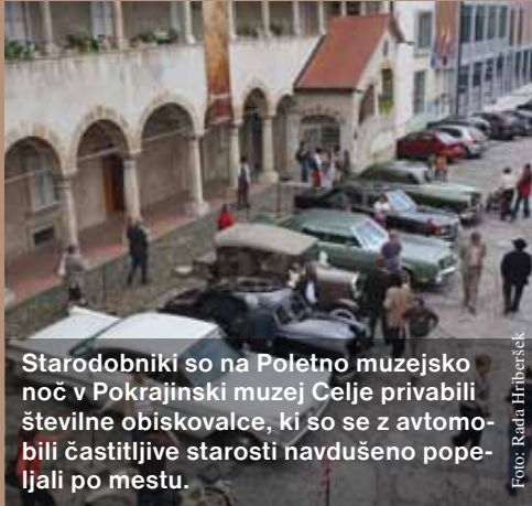
Starodobniki so na Poletno muzejsko noč v Pokrajinski muzej Celje privabili številne obiskovalce, ki so se z avtomobili častitljive starosti navdušeno popeljali po mestu.