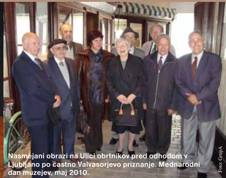
Nasmejani obrazi na Ulici obrtnikov pred odhodom v Ljubljano po častno Valvasorjevo priznanje. Mednarodni dan muzejev, maj 2010.