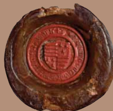
Pečat Barbare Celjske iz leta 1417.