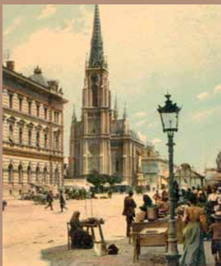
Novi Sad, okrog leta 1908.

V Muzeju novejšje zgodovine Celje bo od 3. novembra do 31. decembra letos na ogled gostujoča razstava Muzeja Vojvodine. Razstava odstira poglede na razvoj mest v Vojvodini in življenje meščanov