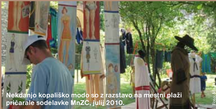
Nekdanjo kopalniško modo so z razstavo na mestni plaži pričarale sodelavke MnZC, julij 2010.