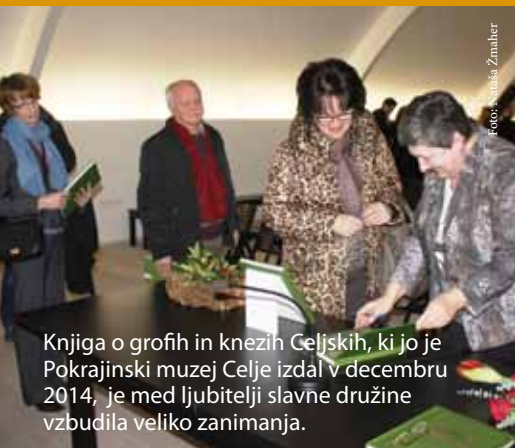
Knjiga o grofih in knezih Celjskih, ki jo je Pokrajinski muzej Celje izdal v decembru 2014, je med ljubitelji slavne družine vzbudila veliko zanimanja.