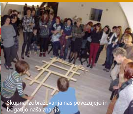
Skupna izobraževanja nas povezujejo in bogatijo naša znanja.