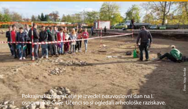
Pokrajinski muzej Celje je izvedel naravoslovni dan na I. osnovni šoli Celje. Učenci so si ogledali arheološke raziskave.