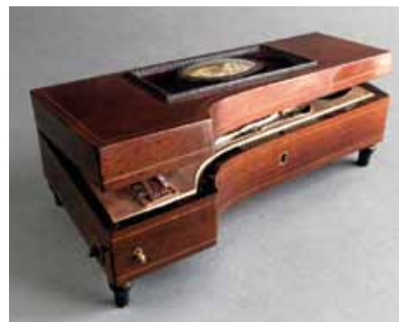
Orkestrion, 1. polovica 19. stoletja.

Že v antiki so poznali tako imenovano eolsko harfo, resonančno škatlo z žicami, ki so v vetru vibrirale in proizvajale zvok. V 13. stoletju se Evropa seznanila s kitajskimi glasbenimi skrinjicami. Od 16. stoletja izdelovalci izpopolnjujejo tehnične rešitve pri avtomatizaciji glasbe. Prve glasbene skrinje in skrinjice, najpopularnejši tip avtomata za hišno uporabo, so začeli izdelovati urarji ob koncu 18. stoletja. Najstarejšo glasbeno uro, ki jo lahko zanesljivo datiramo v leto 1772, je izdelal francoski urar. Leta 1796 pa je ženevski urar patentiral žepno