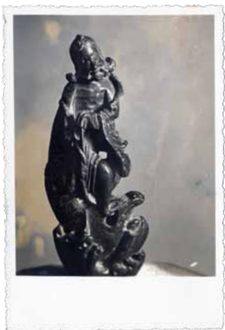
Skrivnostni Li Tieguai.

Dragoceni kitajski kipec iz zbirke Alme M. Karlin, ki ga hrani Pokrajinski muzej Celje, je do nedavnega veljal za pogrešanega. »Inkovski zaklad v podobi hudiča« je dobila v Peruju, na Kitajskem je izvedela, da kipec predstavlja daoističnega nesmrtnika Li Tieguaija, kasneje je postal junak mističnega romana Malik, po njeni smrti pa je skrivnostno izginil.