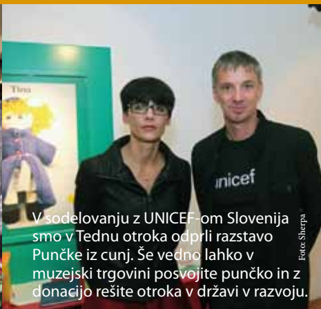
V sodelovanju z UNICEF-om Slovenija smo v Tednu otroka odprli razstavo Punčke iz cunj. Še vedno lahko v muzejski trgovini posvojite punčko in z donacijo rešite otroka v državi v razvoju.