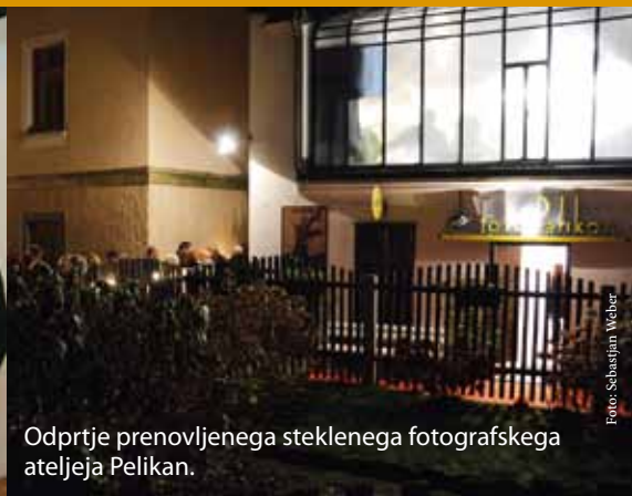
Odprte prenovljenega steklenega fotografskega ateljeja Pelikan.