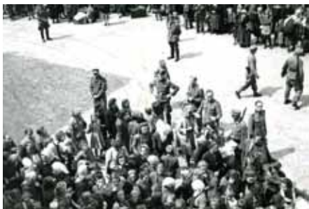
Na dvorišču šole, avgust 1942.