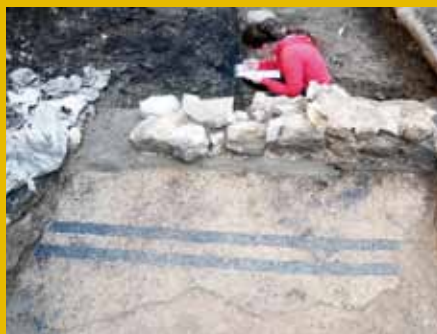
Odkriti ostanki antičnega mozaika.

Dogodki z zgornjim naslovom, ki jih pripravljamo v sodelovanju s Slovenskim ljudskim gledališčem Celje, so novost letošnjega programa MnZC. Z njimi želimo vsebino gledaliških predstav SLG umestiti v širši zgodovinski, pa tudi aktualni družbeni kontekst ter jih ob pomoči zanimivih sogovornikov še bolj približati javnosti. 1. februarja je beseda tekla o večni ljubezenski motiviki Romea in Julije, v sredo, 17. maja, pa bomo v navezavi na predstavo Nebeški odred govorili o nacističnih taboriščnih smrti. T. K.