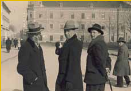
Pred hotelom Pošta, 1931.