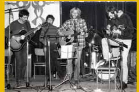
Koncert celjske glasbene skupine Klaidivo, konj in voda, ustanovljene leta 1978.

Poletje bo v Muzeju novejša zgodovine Celje v znamenju popularne kulture. Občasna razstava Jeans generacija: Celjska popularna kultura od kavbojk do mobitela, ki bo na ogled od 11. maja dalje, bo prikazala zgodbo družabnega in kulturnega življenja v Celju skozi predmete, ki so bili priljubljeni pri široki množici ljudi od 50. let 20. stoletja do danes. Razstava bo obudila spomin na različna prizorišča, dogodke, glasbene skupine, manjkale pa seveda ne bodo niti kultne kavbojke. U. Ž.