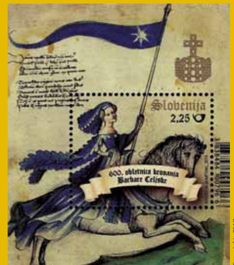
Barbara Celjska na znamki.