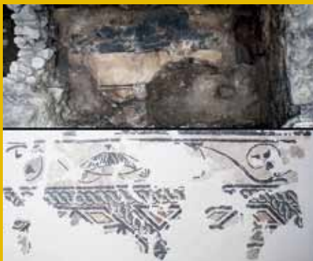
Močno poškodovan mozaik med raziskavami in po zaključenem restavriranju.

Pri obnovi mestnega jedra v letih 2013 in 2014 je prišlo do izjemnih arheoloških odkritij. Poleg srednjeveške kleti prve celjske mestne hiše so bile odkrite tudi ostaline rimske Celeje iz 3. in 4. stoletja n. š. Del teh odkritij (del rimske mestne vile z mozaiki, del kleti mestne hiše) je prezentiran in situ in že od septembra 2016 na ogled v novih prostorih TIC-a. Večbarven mozaik iz rimske vile na lokaciji Glavni trg 13–14, ki je bil močno poškodovan, je po vrnitvi z restavriranja v Restavratorskem centru ZVKDS na ogled v kletni etaži TIC-a. J. K.