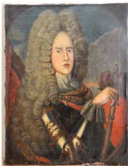
Portret Jožefa I. Habsburškega, neznaní slikar, ok. 1700/10, olje, platno, PMC