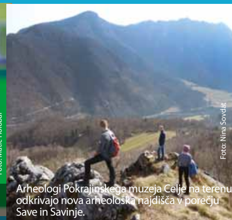
Arheologi Pokrajinskega muzeja Celje na terenu odkrivajo nova arheološka najdišča v porečju Save in Savinje.