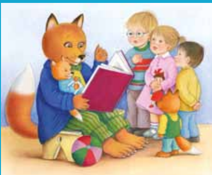
Ilustracija: Jelka Reščman