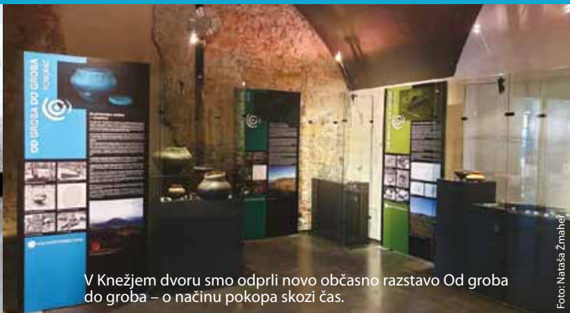
V Knežjem dvoru smo odprli novo občansko razstavo Od groba do groba – o načinu pokopa skozi čas.