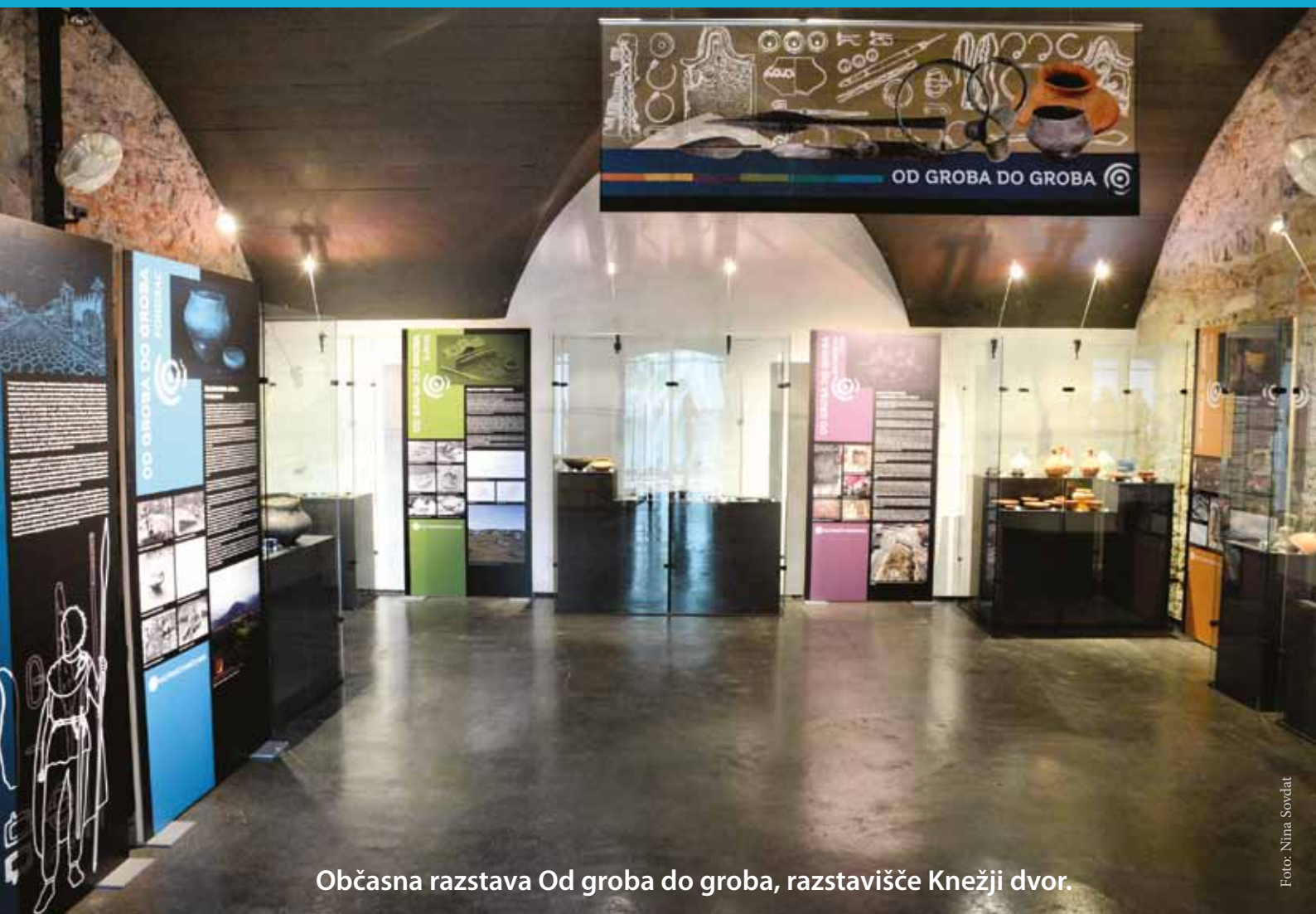
Občasna razstava Od groba do groba, razstavišče Knežji dvor.