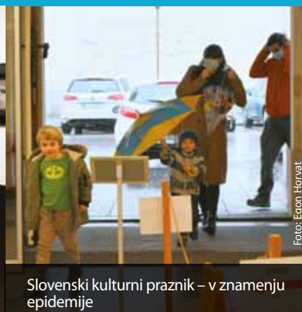
Slovenski kulturni praznik – v znamenju epidemije