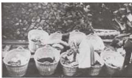
Najmlajši otroci na železniški postaji v Gradcu, 1942

25. junija 1942 je državni vodja SS in nemške policije Heinrich Himmler sprejel »Smernice za izvedbo akcije proti partizanom in drugim banditom na Gorenjskem in Spodnjem Štajerskem« in načrtno nadaljnjo usodo družin, ki so kakorkoli podpirale partizane: »Moške iz teh družin, v mnogih primerih tudi sorodnike, je treba postreliti, ženske zapreti in jih poslati v koncentracijska taborišča, otroke oddaljiti iz njihove domovine in jih namestiti v pokrajinah starega Reicha.« Avgusta 1942 so nemške okupacijske oblasti začele izvajati svoj načrt, v prostore I. osnovne šole v Celju (v času druge svetovne vojne zbirno taborišče) so pripeljali svojce ustreljenih talcev v celjskem in mariborskem zaporu. Žene in dekleta nad 18. letom starosti so odpeljali v koncentracijsko taborišče Auschwitz, otroke in mladostnike pa nasilno odtrgali iz varnega naročja mater in pre-