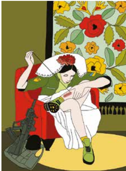
Zgodbe dopolnjujejo vizualne upodobitve in fotografije.