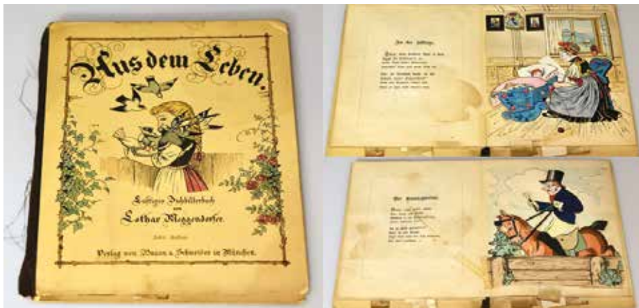
Slikanica Iz življenja, 2. pol. 19. stol.