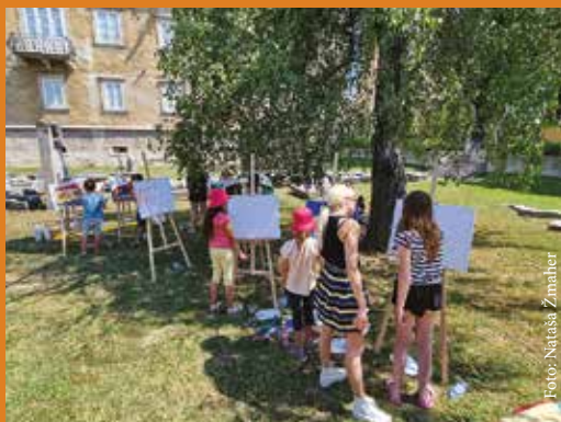
Pestro dogajanje na poučnih poletnih ustvarjalnicah v Pokrajinskem muzeju Celje