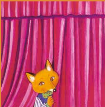
Ilustracije: Tella Reichman

Pred nami je nova sezona predstav za otroke, ki prinaša sedem novih vsebin in srečanj z glasbo ter lutkami in junaki znanih in manj znanih pravljic in zgodb. Predstave so poučne, zabavne, igrive in seveda sporočilne. V program sezone smo tokrat uvrstili tudi edino lutkovno paragedališče v Sloveniji, ki zaposluje invalide. Predstave? Mizica, pogrni se!, To ni pika!, Jelkin čudež, Mojca Pokrajculja, Lisička zvitorepka, Ta čudovita Zemlja in Vznemirljivo življenje čebel. Abonmaji so razprodani, bo pa mogoč nakup posameznih vstopnic v tednu pred predstavo. Spremljajte nas na muzejski spletni strani in družbenih omrežjih. J. T.