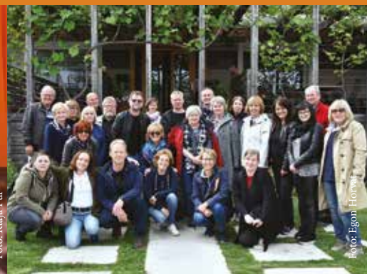
Ekскурzija s prostovoljci MnZC na Dolenjsko