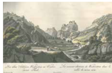
Vitanje, kolorirana jedkanica, ok. 1800