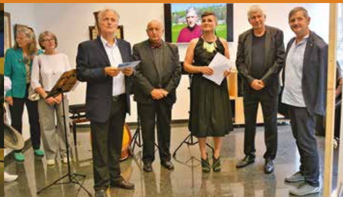
Gostovanje razstave o Antonu Perku v Korotanu na Dunaju