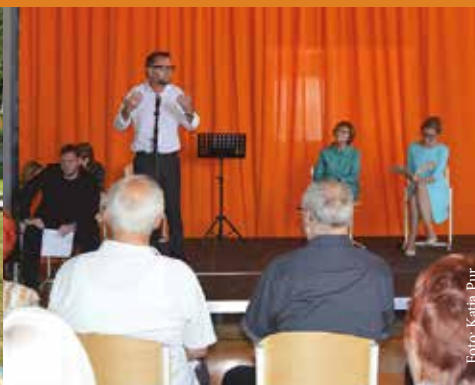
Otroka pozabljene domovine, slovesnost ob 80-letnici izgona in ločitve mater in otrok, I. OŠ Celje