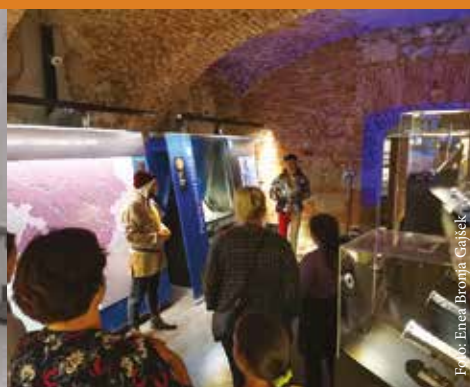
Novost v Pokrajinskem muzeju Celje, kostumirana vodenja po stalni razstavi Grofje Celjski