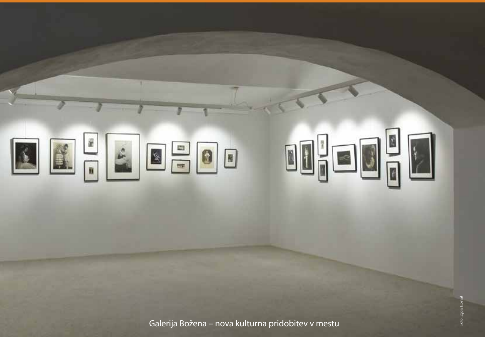
Galerija Božena – nova kulturna pridobitev v mestu