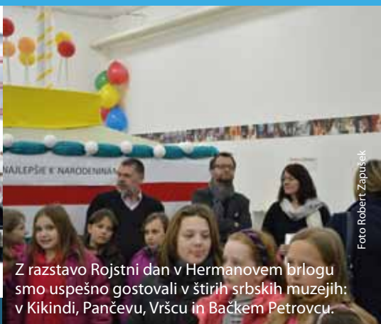
Z razstavo Rojstni dan v Hermanovem brlogu smo uspešno gostovali v štirih srbskih muzejih: v Kikindi, Pančevu, Vršču in Bačkem Petrovcu.