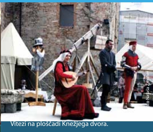
Vitezi na ploščadi Knežjega dvora.