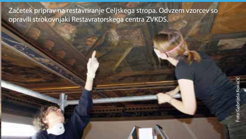
Začetek priprav na restavriranje Celjskega stropa. Odvzem vzorcev so opravili strokovnjaki Restavratskega centra ZVKDS.