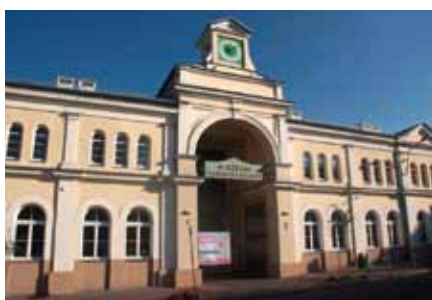
Muzej igrač in iger v Kielcah na Poljskem.