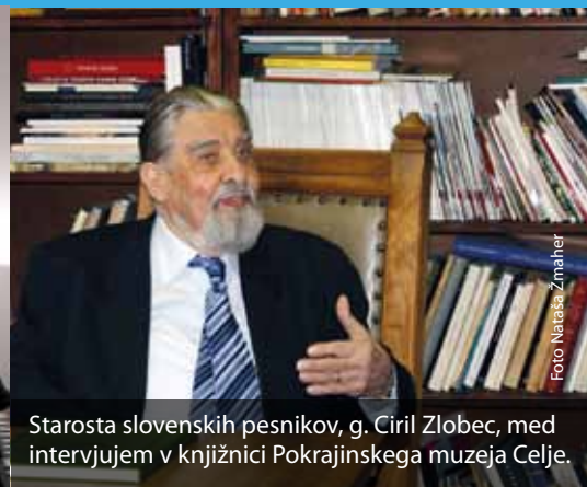
Starosta slovenskih pesnikov, g. Ciril Zlobec, med intervjujem v knjižnici Pokrajinskega muzeja Celje.