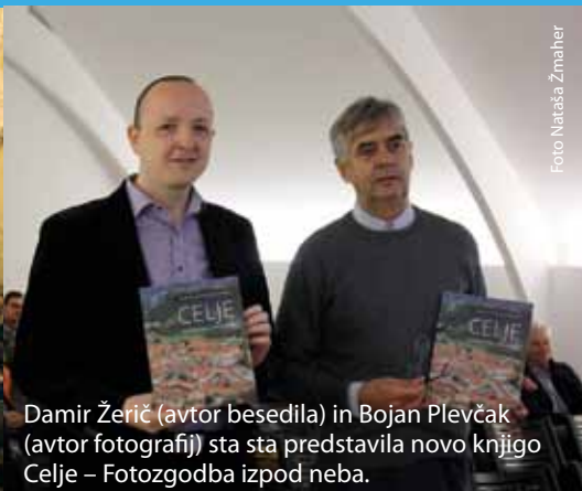
Damir Žerič (avtor besedila) in Bojan Plevčak (avtor fotografij) sta predstavila novo knjigo Celje – Fotozgodba izpod neba.