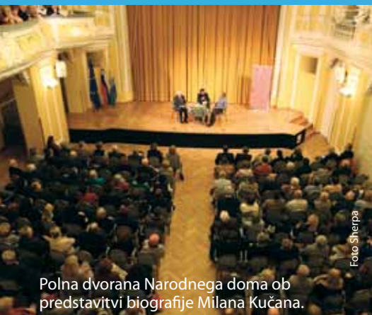
Polna dvorana Narodnega doma ob predstavitvi biografije Milana Kučana.