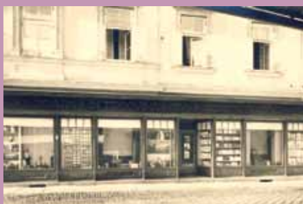
Celjska knjigarna Mohorjeve pred 90 leti.

V MnZC smo ob 90-letnici prihoda Mohorjeve družbe v Celje odprli razstavo Čim enotnejši, tem močnejši! Mohorjeva družba je med drugim pomembno vplivala tudi na kulturni utrip Celja, kamor se je priselila leta 1927 zaradi tedanjih razmer: na Prevaljah, kjer je po selitvi iz Celovca bivala osem let, ni imela možnosti širitve, pa tudi od uredništva v Ljubljani je bila preveč oddaljena. Razstava, ki smo jo pripravili v sodelovanju s Celjsko Mohorjevo družbo in ki bo na ogled do konca letošnjega leta, bo spregovorila o kulturnozgodovinski vlogi te najstarejše slovenske založbe. M. P.