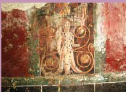
Eden od motivov na freskah.

Arheološke raziskave v sklopu obnove Muzejskega trga so pokazale, da so na mestu Stare grofije v srednjem veku stali mogočni upravni in gospodarski objekti Knežjega dvora, ki so bili doslej poznani le iz pisnih virov. Postavljeni so bili nad rimskodobnimi zidovi, ko je bil celoten prostor trga pozidan z bogatimi mestnimi vilami. Najbolj presenetljivo najdbo predstavljajo freske iz druge polovice 1. stoletja, ki so se na zidovih ohranile do višine 1 metra, medtem ko so bili odlomki z zgornjih delov zidov in s stropa najdeni v ruševinah objekta. Glede na kvaliteto izdelave, bogato ornamentiko ter ohranjenost gre za odkritje izjemnega pomena. M. B.