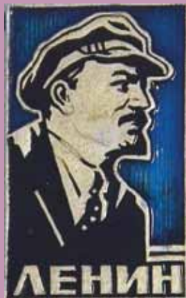
Značka iz muzejske zbirke.