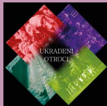
Oblikovanje: Jana Špendl

Letos mineva 75 let od tragičnega dogodka, ki je za vedno zaznamoval življenja 600 otrok. Leta 1942 so nemške okupacijske oblasti v prostorih I. osnovne šole v Celju (v času II. svetovne vojne zbirno taborišče) otroke in mladostnike pod 18 letom starosti nasilno odtrgale iz varnega naročja mater in prekinile njihova brezskrbna leta odraščanja. Odpeljali so jih v posebna mladinska prevzgojna taborišča v Nemčijo, kjer so jim s strogo nemško vzgojo skušali odvzeti vse, kar bi jih spominjalo na dom in ljubezen do staršev. Razstava v prostorih šole ohranja spomin na tragične usode ukradenih otrok D. J.