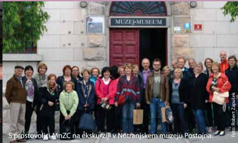
S prostovoljci MnZC na ekskurziji v Notranjskem muzeju Postojna.