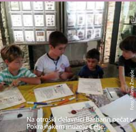
Na otroški delavnici Barbarin pečat v Pokrajinskem muzeju Celje.