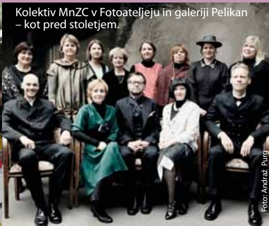
Kolektiv MnZC v Fotoateljeju in galeriji Pelikan – kot pred stoletjem.