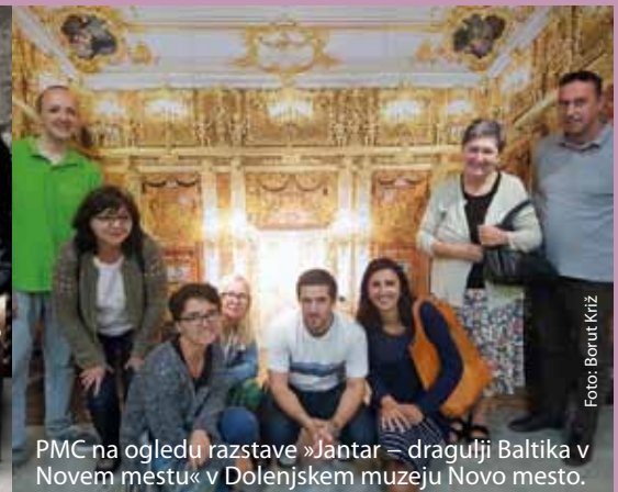
PMC na ogledu razstave »Jantar – dragulji Baltika v Novem mestu« v Dolenjskem muzeju Novo mesto.