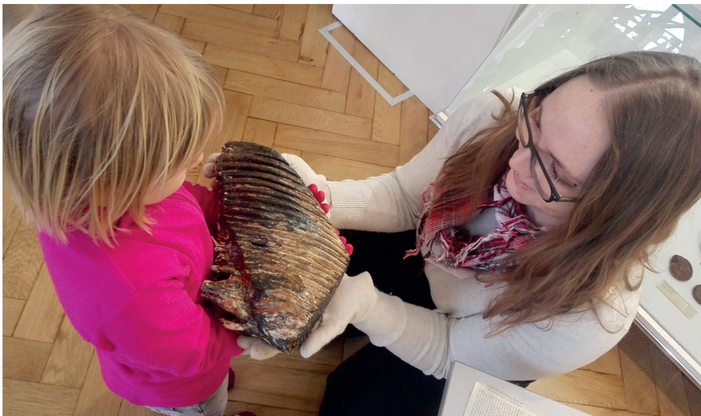
Kadar je na programu Dotikanje dovoljeno, lahko obiskovalci potežkajo pravi mamutov zob. Prostovoljke in prostovoljci pa jim predstavijo še mnoge zanimivosti o tem izumrlem ledenodobnem velikanu.

Družine si lahko brezplačno izposodijo tudi druge programe za samostojno uporabo, kot so Skrinjice učenosti ali Skrivnosti poln nahrbtnik. V njih se skrivajo različne naloge za otroke, ki na ta način, pod vodstvom in s pomočjo staršev, raziskujejo naše razstave. Lotijo pa se lahko tudi nalog pod naslovom Poišči v muzeju. Na plastificiranih predlogah s posebnimi flomastri vpisujejo svoje odgovore, ki so lahko tudi subjektivni in ne zgolj faktografski. Tako obiskovalce spodbujamo k opazovanju in razmišljanju ter s tem gradimo odnos do narave. Na voljo je več vsebin za različne starostne stopnje otrok. Svoje rešitve pri informatorjih zamenjajo za darilce.