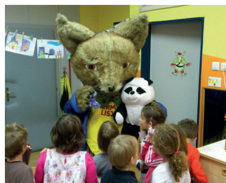
Boljši sejmi za otroke in zbiralne akcije sodobnih igrač.

Na stalni razstavi je na voljo prostor, kjer lahko otroci menjajo ali podarijo igrače, občasno pa organiziramo izmenjevalnice igrač.