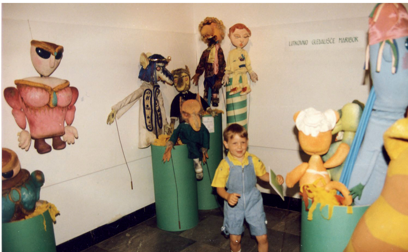
V svetu lutk - poskus otroškega muzeja leta 1992.