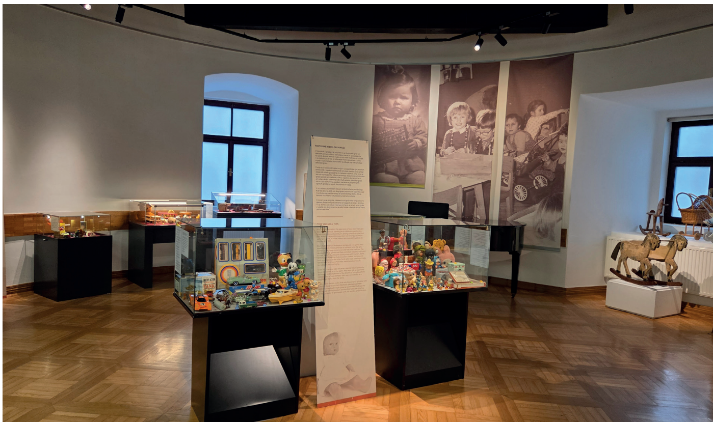
Na Ta veseli dan kulture leta 2025 smo razstavo odprli v Posavskem muzeju Brežice.

predmete, ki jih sodelujoči muzeji hranimo.