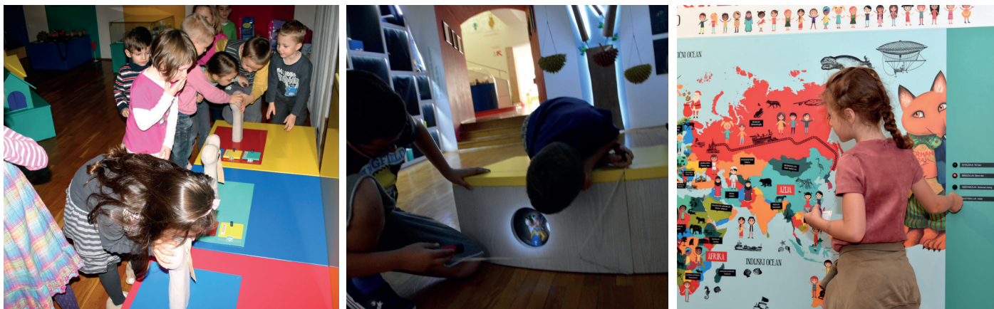
Veččutno raziskovanje in učenje skozi igro.

Razstave vabijo in nagovarjajo k lastnemu raziskovanju ter razmišljanju, omogočajo aktivno participacijo obiskovalcev in spodbujajo otroško radovednost, pogosto skozi veččutno igro in po zaznavnem sistemu VAKOG. Refleksije in evalvacije, ideje kustosov, otrok in zainteresirane javnosti ter mnogi drugi dejavniki nas nagovarjajo k razstavnim usmeritvi.