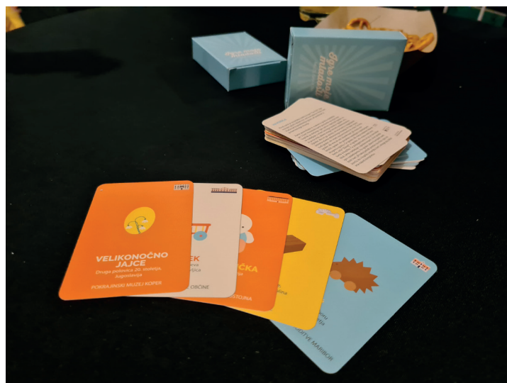
Vsakoletna razstava dobi tudi prav posebno družabno igro.

Leta 2023 smo sprejeli povabilo Muzeja Velenje. Tam smo imeli na voljo precej več razstavnega prostora, zato smo si skupaj s kustosinjami muzeja zamislili nadgradnjo razstave z njihovim bogatim fotografskim fondom. Tako v uvodnem kot tudi v osrednjem razstavnem prostoru smo vključili stare fotografije, ki so razstavi dale poseben vizualni pečat. Postavitev smo prilagodili prostorskim možnostim, med drugim pa smo v nišah razstavili tudi večje igrače, ki jih v prejšnjih edicijah nismo mogli predstaviti v takšnem obsegu. V sodelovanju z Muzejem Velenje in ostalimi partnerji smo pripravili tudi novo različico spremljevalne družabne igre. Medtem ko smo v Kopru na zloženki uporabljali različico igre Človek, ne jezi se, v Kropi pa Lestve in tobogani, smo se v Velenju odločili za korak naprej in razvili povsem svojo muzejsko različico priljubljene igre Dobble. V tej verziji igralci iščejo skupni motiv na svoji kartici in kartici, ki je obrnjena na sredini igralne površine. Gre za izdelek, ki smo ga prodajali vsi sodelujoči muzeji.