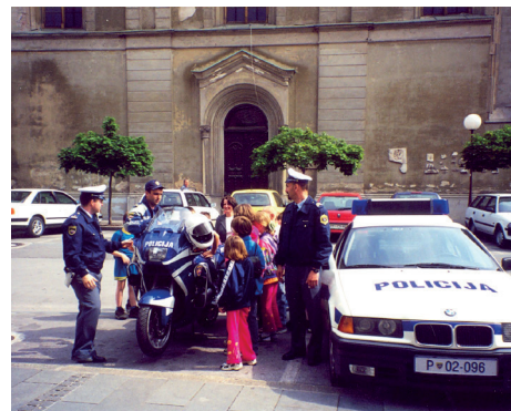
Odprtje prve otroške telefonske govornice (1997), Program varčevanja z Banko Celje in ogled poslovalnice na Prešernovi ulici (2001) ter projekt Varno v prometu: pogovor s policisti in ogled vozil (2001).

Številke so naravnost osupljive! Izvedli smo vsaj 16.475 aktivnosti ; najpogosteje izvedeni programi bodo predstavljeni v nadaljevanju članka.