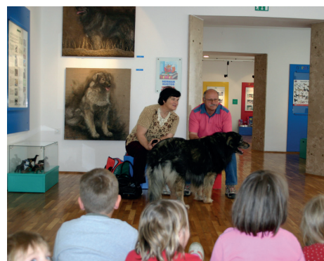
Srečanje s slovenskimi ilustratorji (2007), obisk Kapitana Gatnika (2008) in srečanje s kraškim ovčarjem Vikom (2009).