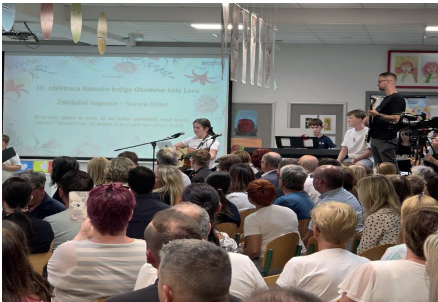
Rastoča knjiga.

Umetnost, igra, odkrivanje novih svetov, ki otroku ponujajo bogato čustveno doživljanje, ga učijo vrednot spoštovanja, odnosa do branja, znanja, igre, umetnosti ..., zagotavljajo odlično osnovo za odraslo življenje.