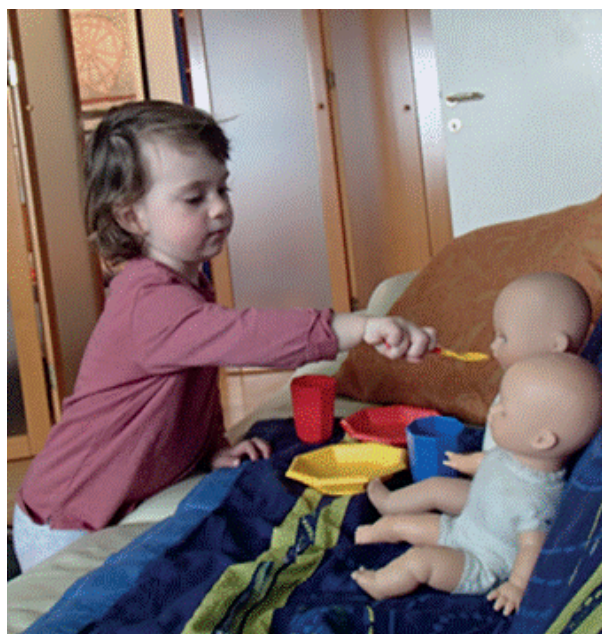
Začetna simbolna igra. Malčica se igra z igračkami, ki so replike resničnih predmetov - hrani dojenčka.

Otroci se najbolj pogosto, vsebinsko poglobljeno in najdlje igrajo simbolno. Z razvojem malčkov/otrok se simbolna igra spreminja. Tako malčki v spontani simbolni igri najprej posnemajo enostavne in posamezne dejavnosti, ki jih vidijo okoli sebe (npr. previjanje dojenčka, hranjenje otroka, vožnja avtomobila) ter pri tem rabijo replike predmetov iz okolja, ki so zaznavno in glede na funkcijo podobni resničnim predmetom (npr. kuhajo v posodici, ki je podobna pravi; uporabljajo kuhalnico, ki je podobna pravi, vozijo avto, ki je podoben resničnemu avtu).