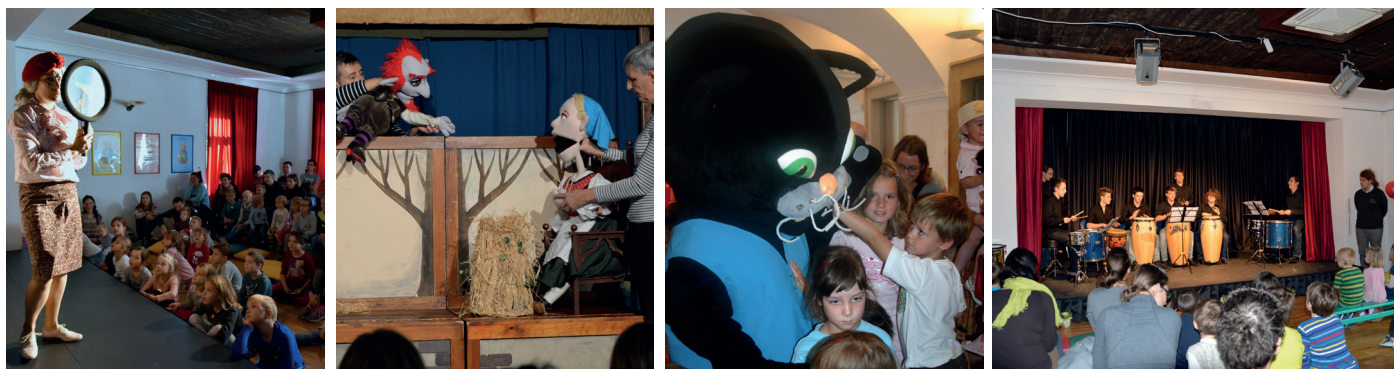
Predstave v Hermanovem gledališču: Bonton za male lumpe, Škratovo ime in Maček Muri ter Glasbena sobotnica: Vznemirljivi svet tolkal. Pedagoška fototeka, MnZC

Kar 10 sezon (med leti 2012 in 2022) je bilo v muzeju slišati tudi Glasbene sobotnice - veliko glasbo za male otroke. Program je nastajal v sodelovanju s Hišo kulture Celje. V tem obdobju se je zvrstilo 59 glasbenih predstav , ki jim je prisluhnilo 4.676 obiskovalcev . Predstave so bile moderirane.