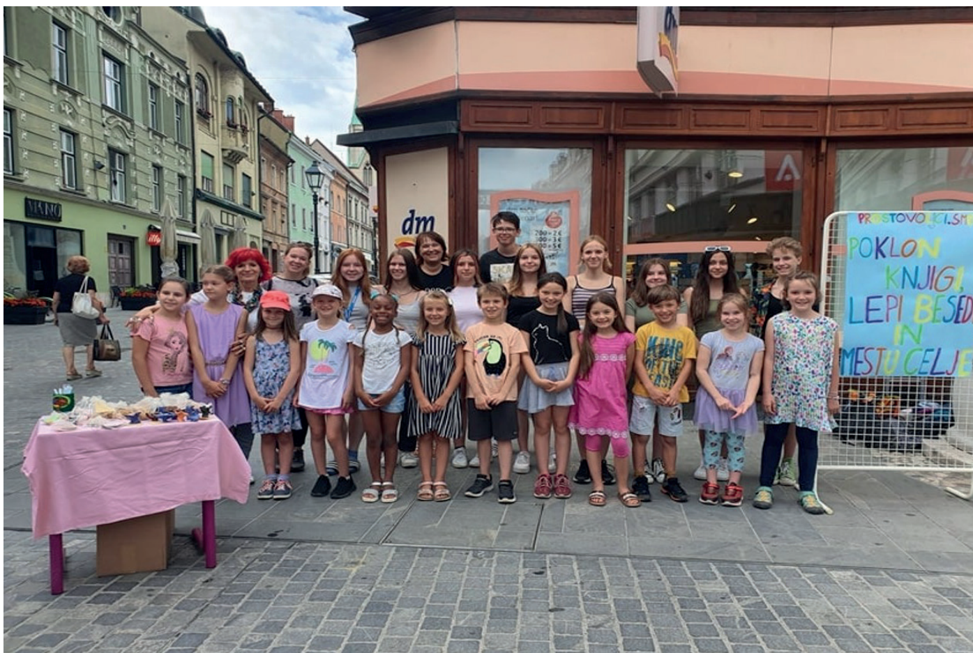
Poklon knjigi, lepi slovenski besedi in mestu Celju.