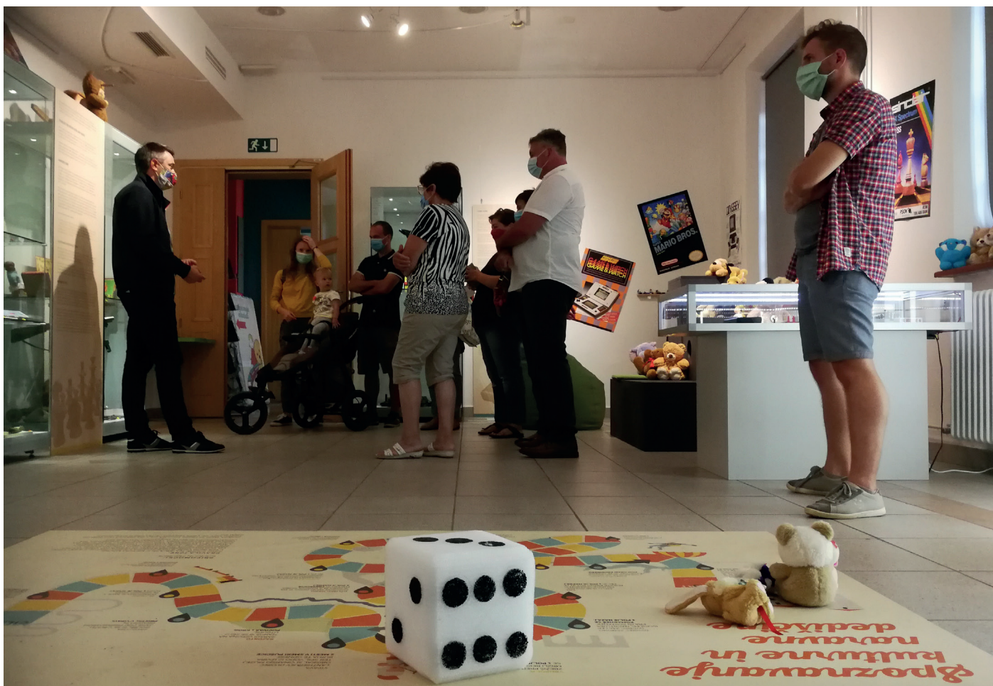
Prvo gostovanje v Notranjskem muzeju Postojna je potekalo v času epidemije

Leta 2020 je bila na pobudo Notranjskega muzeja Postojna prvič postavljena gostujoča razstava Igre moje mladosti. Šlo je za nadgrajeno različico razstave, vendar takrat še ne za pravo medmuzejsko postavitev. Novost v primerjavi s prejšnjim konceptom je bila predvsem poudarjena vloga igranja družabnih iger. V ta namen smo skupaj zasnovali posebno družabno igro, ki je bila obiskovalcem na voljo brezplačno v obliki zgibanke oziroma kot talna igra v razstavnem prostoru. Gre za igro z naslovom Spoznavanje kulturne in naravne dediščine, zasnovano kot potovalno igro, ki je igralce vodila od Notranjskega muzeja do Gradu Kromberk ali v obratni smeri. Na poti so se srečevali z različnimi zanimivostmi ter dejstvi iz naravne in kulturne dediščine. Igralci so si za igro lahko izposodili figurice in kocke iz drugih družabnih iger, ki jih večinoma imajo doma. Na hrbtni strani zloženke so bile objavljene tudi fotografije in zgodbe izbranih igrac v prvi osebi. Zgodbe teh igrac nas spremljajo na vseh kasnejših gostovanjih. Na razstavišču smo ponovno predstavili tudi videoigre, tokrat obogatene z izobraževalnima videoma, ki predstavijo zgodovino videoiger.