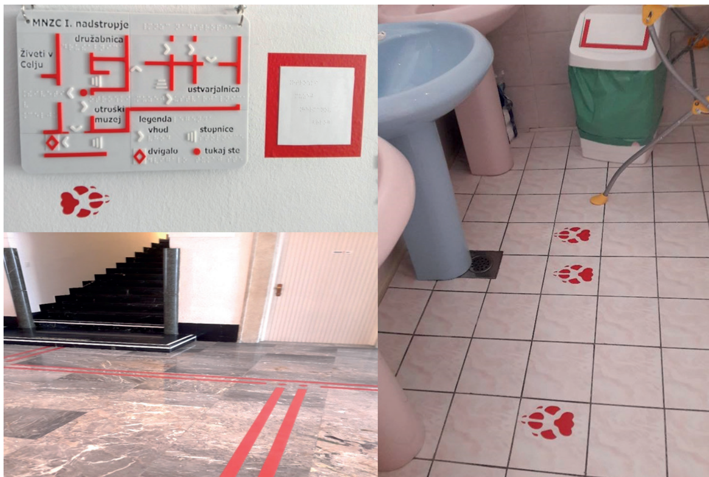
Nekaj primerov oznak za obiskovalce z okvaro vida v Muzeju novejšje zgodovine Celje.