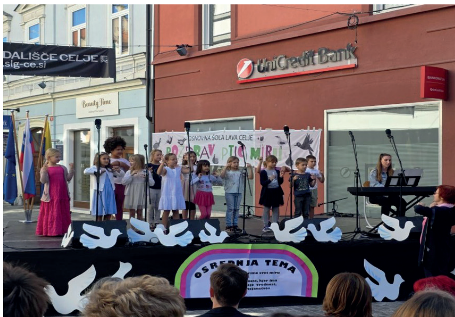
Rastoča knjiga.

Tako osnovne šole uresničujemo obvezni program (pouk v skladu z Učnimi načrti) in bogat razširjen program, v okviru katerega iščemo številne možnosti, dejavnosti, projekte na področjih umetnosti, ustvarjalnosti, inovativnosti, kreativnosti, podjetnosti, humanitarnosti, gibanja. Izkoriščamo tudi bogato ponudbo muzejev, galerij, gledališč, športnih društev in zvez, znanstvenih parkov, kjer se otroci učijo na drugačne načine (veliko igre, raziskovanja, kreativnega ustvarjanja) kot v šoli v okviru pouka. Otrokom omogočamo izkušensko učenje v okviru sodelovanja z različnimi kulturnimi, izobraževalnimi ustanovami, ki pozitivno vplivajo na mlade.