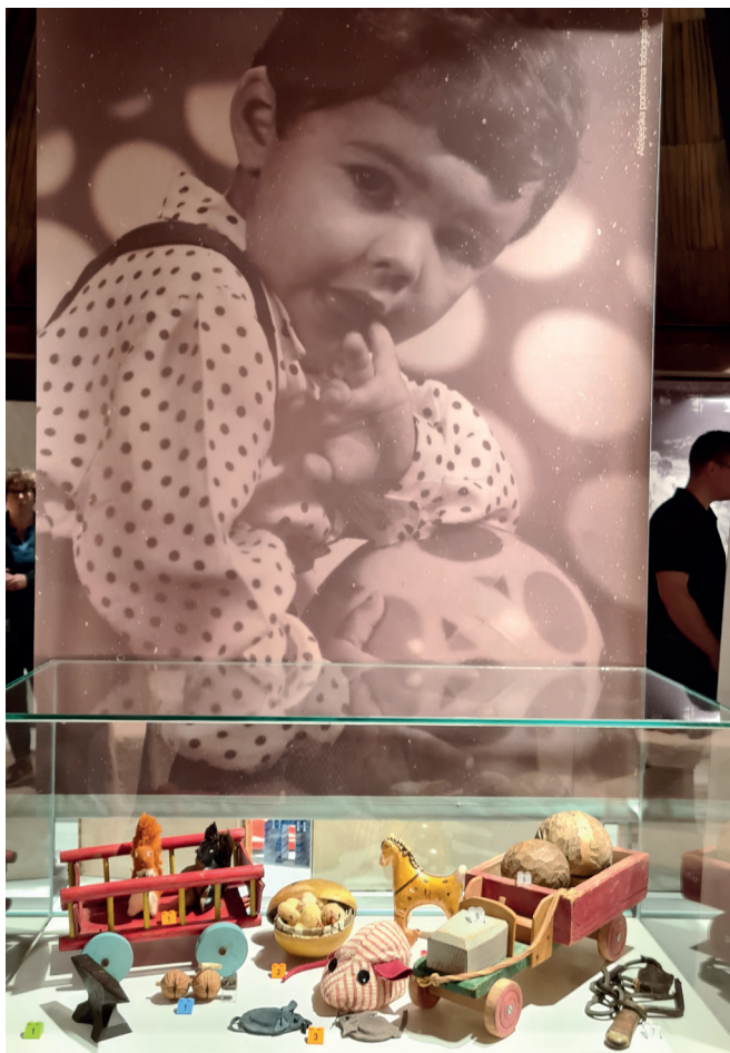
Razstavo v Velenju smo dopolnili s fotografijami iz etnološkega oddelka tamkajšnjega muzeja.

Naslednje leto smo se preselili v Kovaški muzej Kropa, ki deluje v okviru Muzejev radovljiške občine. Ob odprtju so sodelovali otroci iz vrtca, pridružila pa se je tudi lokalna dramska skupina kulturnega društva Kropa - Čofta. Ena izmed vitrin je bila namenjena predstavitvi zbirke »spačkov« lokalnega zbiratelja ter družabne igre s kartami, ki jo ljubitelji teh starodobnikov redno igrajo na svojih srečanjih. Osnovni koncept razstave je ostal nespremenjen, smo pa zaradi lokalnega okolja več poudarka namenili doma izdelanim igračam, saj Kropa s svojo tradicijo kovaštva in drugih obrti ponuja dragocen vpogled v obrtniško ustvarjalnost.