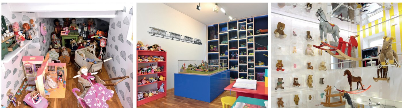
Razstavljena dediščina na stalni razstavi.

V Otroškem muzeju zbiramo, raziskujemo, hranimo in razstavljamo kulturno dediščino. Skrbimo za primerno obravnavo in hranjenje muzealij. Trudimo se, da predmeti in njihove zgodbe čim večkrat oživijo na muzejskih razstavah, da jih razstavimo v novih kontekstih na razstavah ali da oživijo na drugih muzejskih programih.