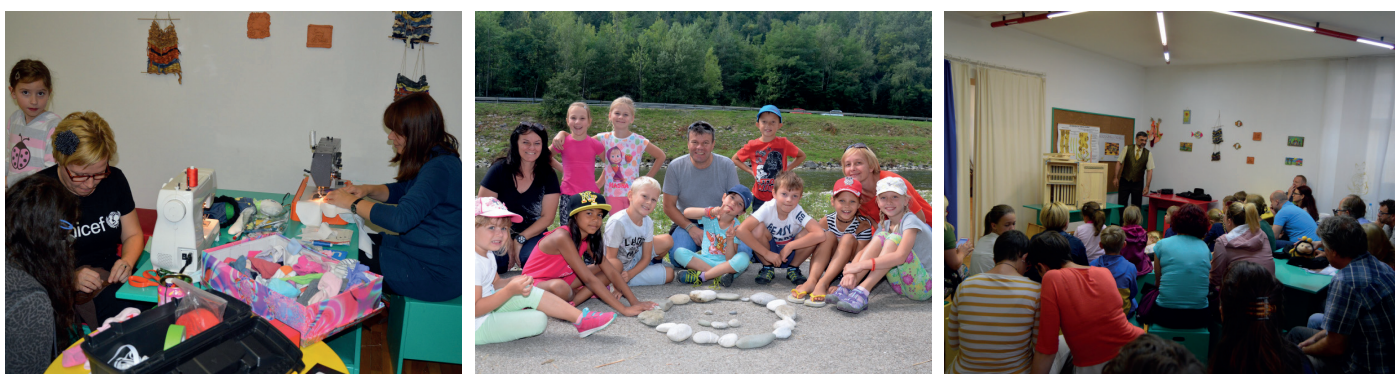
Postani prostovoljec in sešij punčko, UNICEF (2014), M-kot muzej, počitniški program (2017) in Obisk čebelarja na 1. svetovni dan čebel (2018).