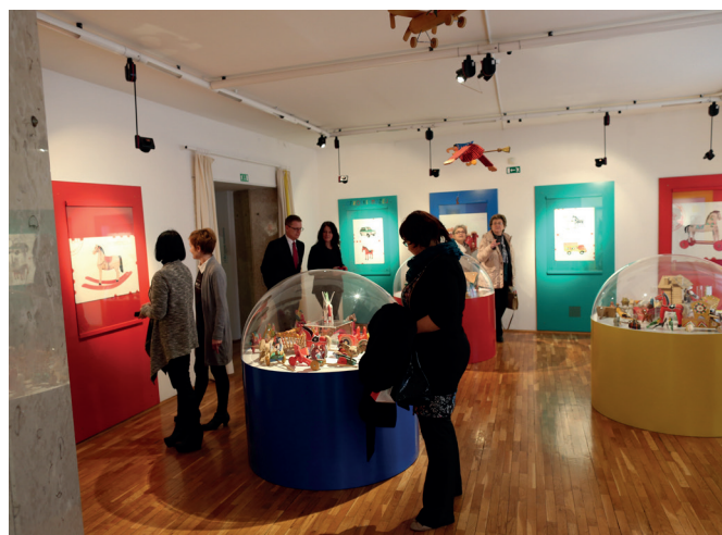
Razstavi Moj rojstni dan (2011) in Tradicionalne poljske otroške igrače (gostovanje Muzeja igrač in iger iz Kielc na Poljskem, 2014).