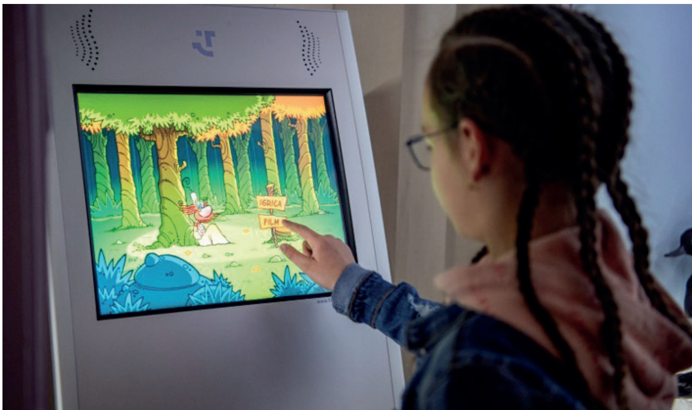
Ob igri poučnih računalniških igrvic se otroci učijo in zabavajo.